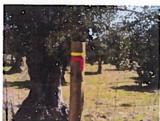
Ilustração 1: Suportes para colocação de marcas.