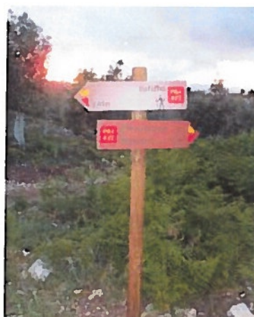
Ilustração 2: Placas indicativas de sentido de percurso