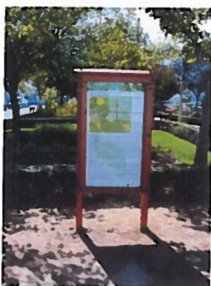
Ilustração 3: Painel informativo